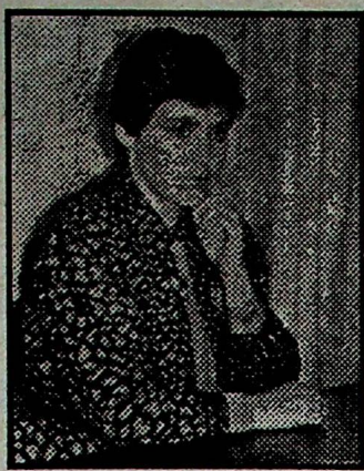
Окончание. Начало на 1 стр.

А за выполнение принятых законов и правил постановлений отвечает, очевидно, самоуправление. Но все сводится к тому, что до сих пор нет государственной программы обучения литовскому языку. И решать эту проблему должно в первую очередь Министерство культуры и просвещения совместно с департаментом национальностей и представителями правительства. Биться же в одиночку без денег, без помеще-